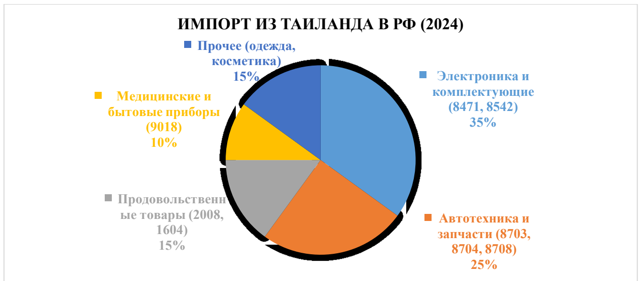
Рисунок 2. Импорт России из Таиланда в рамках ТН ВЭД в 2024 году (составлено авторами). / Figure 2. Russian imports from Thailand under the HS in 2024 (compiled by the authors).