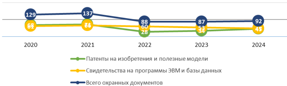
Рисунок 1. Динамика количества объектов интеллектуальной собственности ДВФУ, зарегистрированных в государственных реестрах РФ в 2020-2024 гг. /